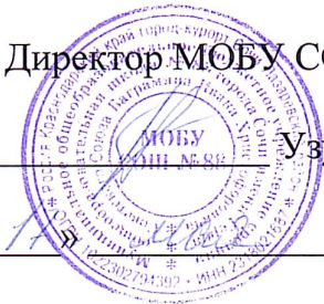
СХЕМА ДВИЖЕНИЯ ДЕТЕЙ ПО ТЕРРИТОРИИ ПРОФИЛЬНОГО ЛАГЕРЯ «ВЕСЁЛОЕ ПУТУШЕСТВИЕ» НА БАЗЕ МОБУ СОШ № 88