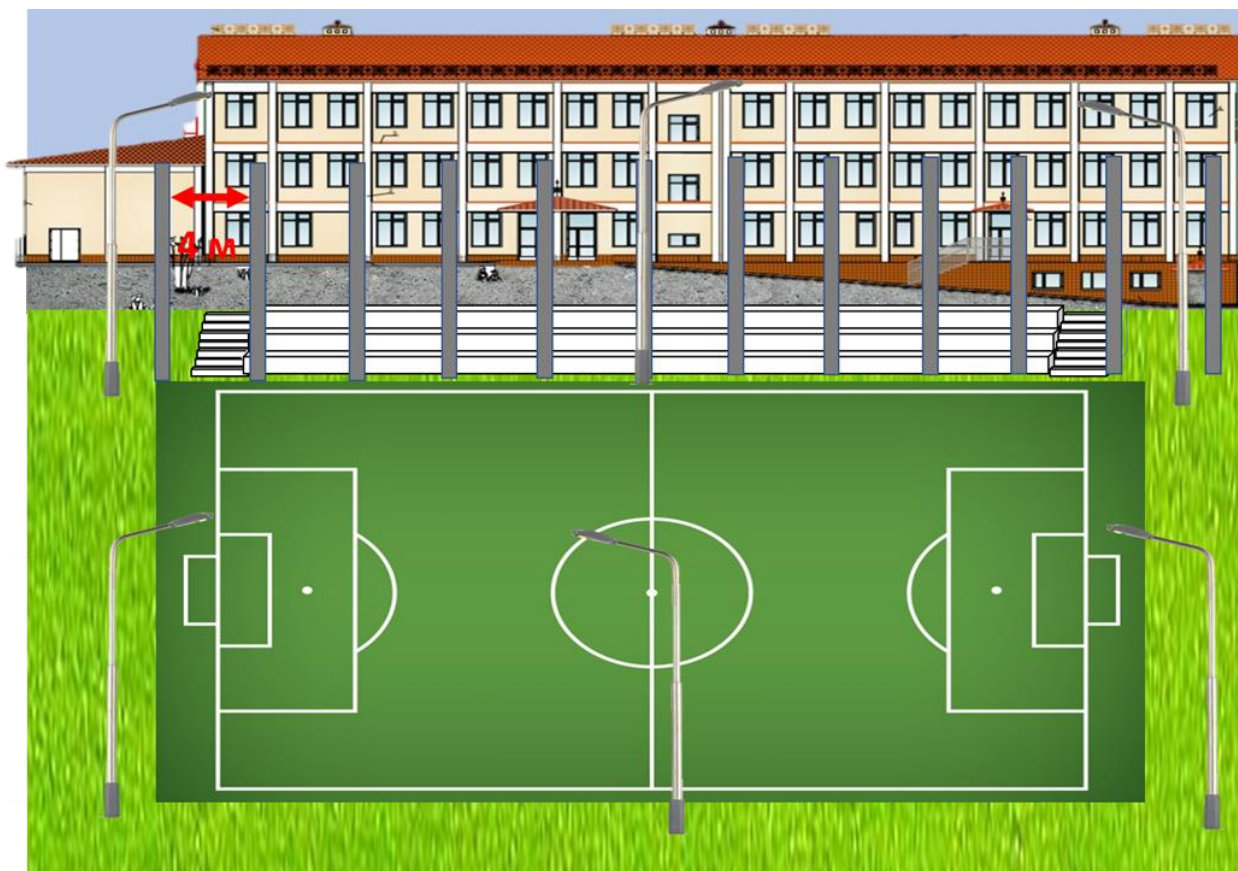
Схема будущего стадиона

Третий этап создания подразумевает установку отремонтированных фонарных столбов с заменёнными прожекторами, и столбов (5 м), которые будут