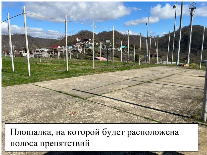
Площадка, на которой будет расположена полоса препятствий

Полоса препятствий будет расположена между новым стадионом и школьным забором.